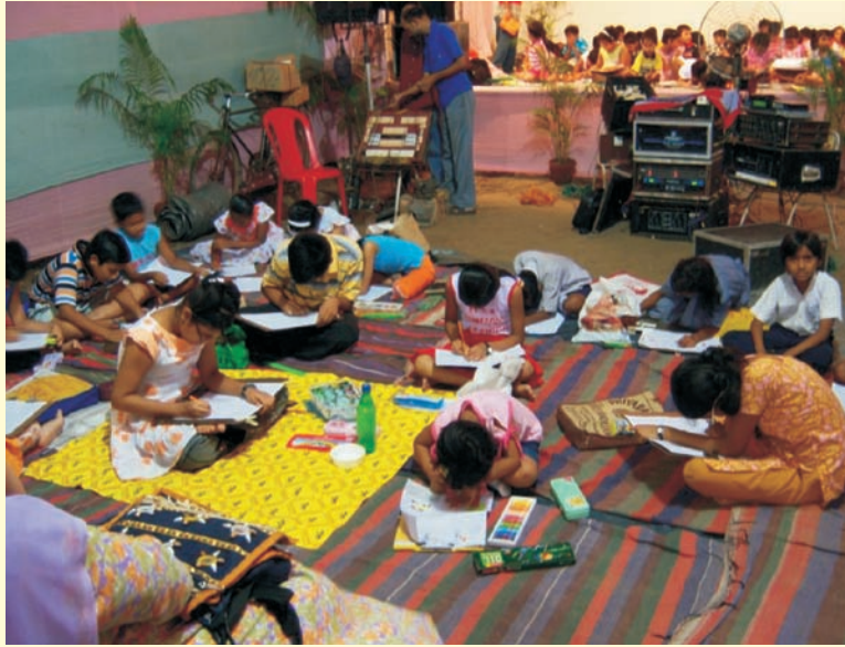
83 participants of different age group took part in a drawing contest on an environmental theme.