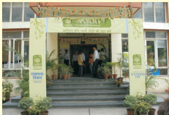
Welcome gate at the entrance