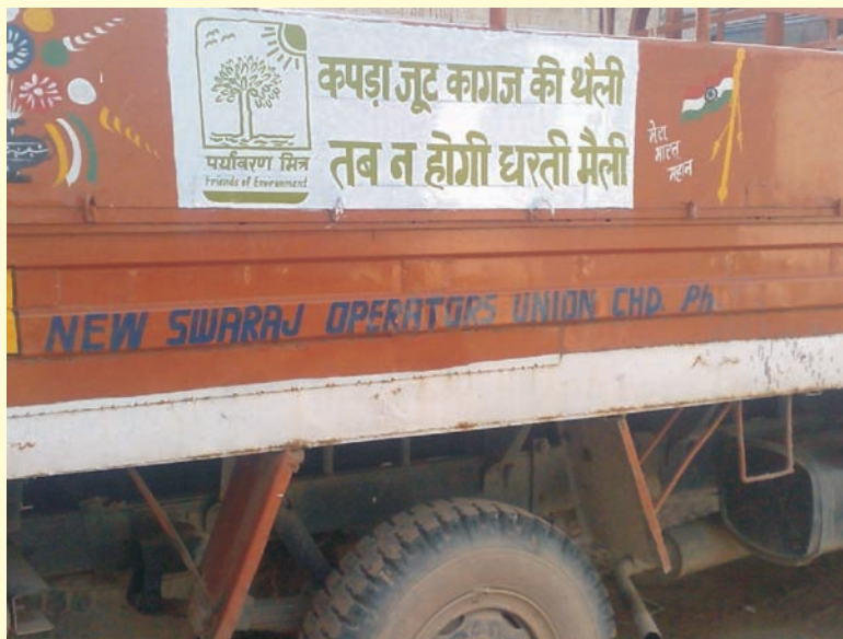
Chandigarh: C&FA vehicle carrying PM message. चण्डीगढ़ : पीएम का संदेश ले जाता हुआ सी एण्ड एफ ए वाहन

Chandigarh PM Parivar got PM messages painted on the C&FA vehicle which would serve as mobile publicity.