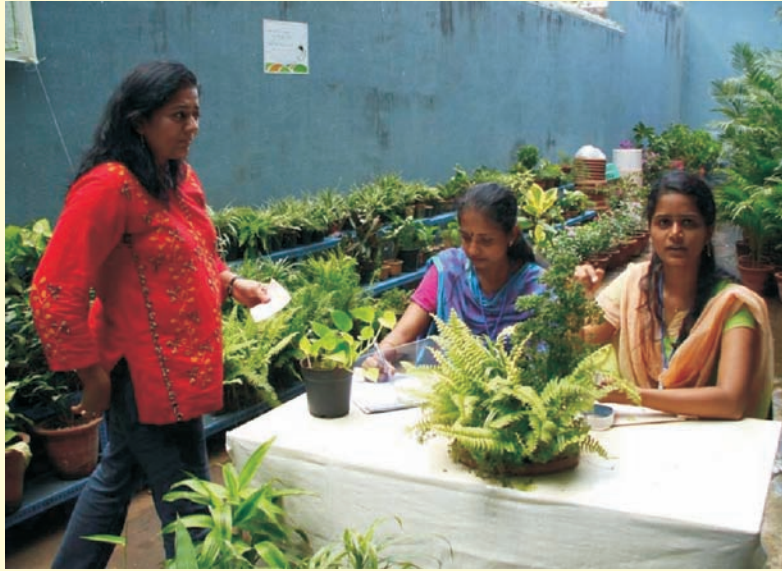
PM Booth at Reay Road office (above) and at Railway Station (below) पर्यावरण मित्र बूथ-रे रोड ऑफिस (ऊपर) तथा रेलवे स्टेशन (नीचे)