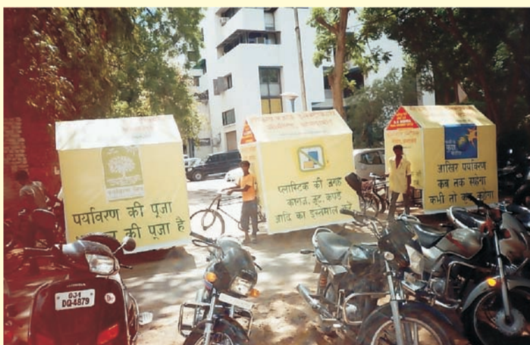
Ahmedabad: PM message on cycle rickshaws.

बच्चों में स्वच्छ पर्यावरण के महत्त्व का बीज अंकुरित करने के लिए बंगलोर के पर्यावरण मित्र परिवार द्वारा यहां के सिद्धगंगा पब्लिक स्कूल में "पर्यावरण की सुरक्षा" विषय पर ड्राइंग एवं पेन्टिंग प्रतियोगिता का आयोजन किया गया.