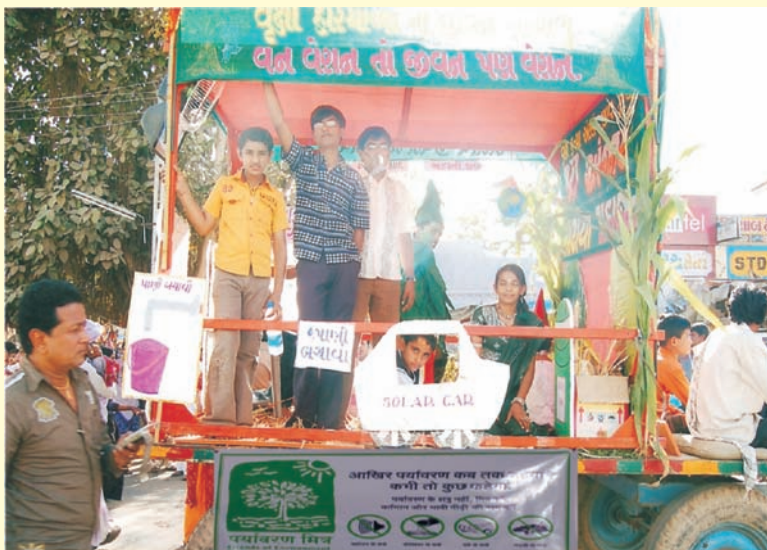
During the procession children prepared beautiful banners on a camel cart