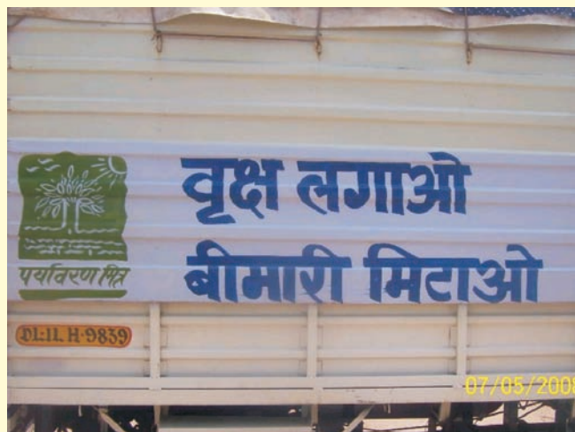
Delhi PM Parivar got the C&FA vehicles painted with PM Slogans. दिल्ली पीएम परिवार ने सी एंड एफ वाहनों को पीएम स्लोगनों से पेंट करवाया.