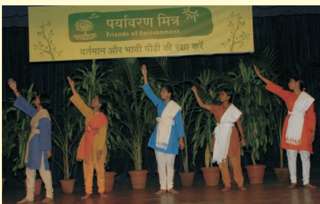
A scene from the play 'Ye hai Mumbai Meri Jaan' नाटक 'ये है मुम्बई मेरी जान' का एक दृश्य.