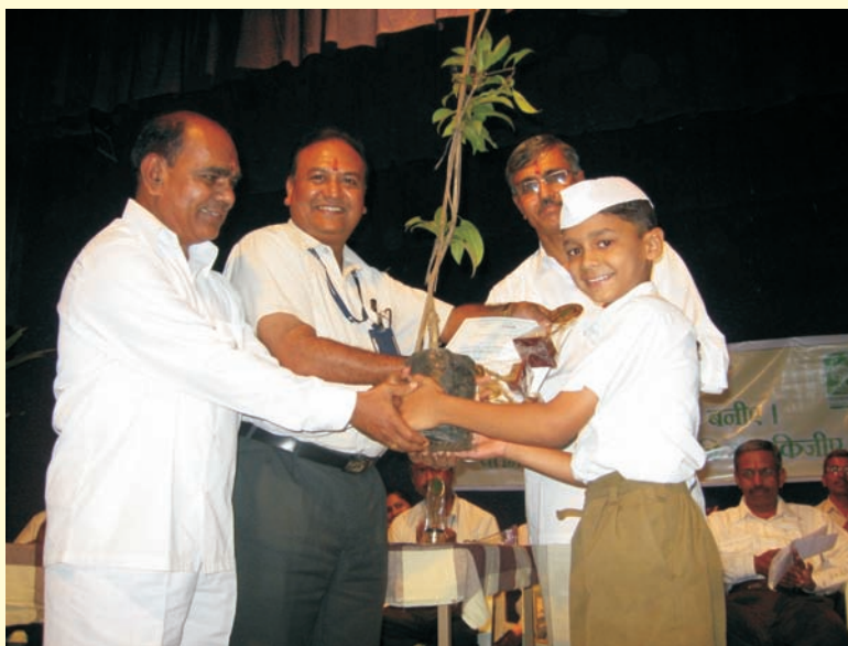
A winner receiving the award in a contest organized by Ranjangaon Unit at Vidya dham Prashala)

रंजनगांव युनिट स्थित विद्याधाम प्रशाला में आयोजित प्रतियोगिता में पुरस्कार ग्रहण करता विजेता.