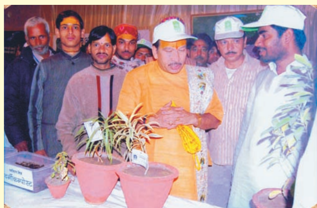
Shri Thakurji in PM stall.