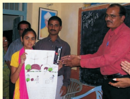
Indore PM Pariwar organized a drawing competition at Gurukul Madhyamik Vidyalaya. Winning students displaying their drawings इंदौर पर्यावरण मित्र परिवार द्वारा गुरुकुल माध्यमिक विद्यालय में एक ड्राइंग प्रतियोगिता का आयोजन किया गया. विजेता विद्यार्थी अपनी ड्राइंग्स के साथ.