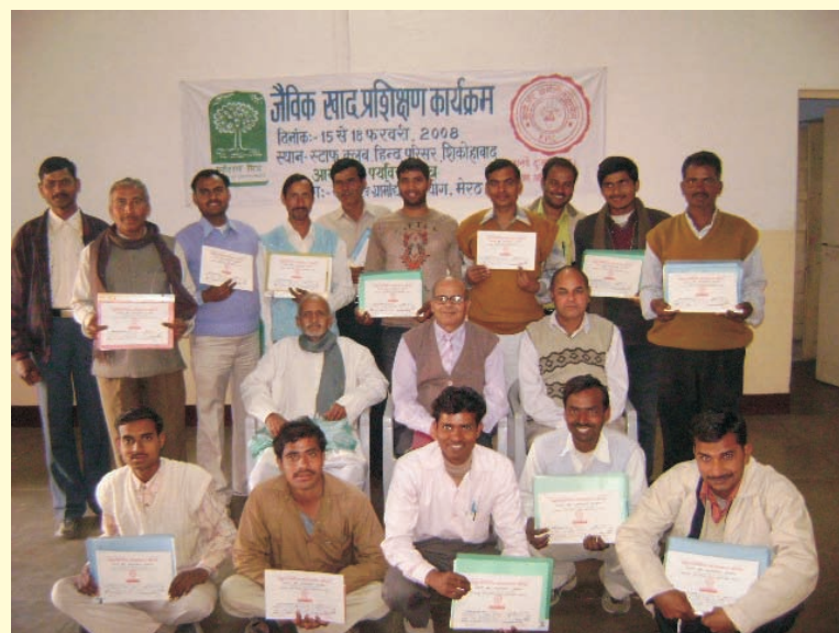
Shikohabad: The participating farmers with their certificates.

शिकोहाबाद : जैविक खाद के गड्ढे के पास प्रतिभागी