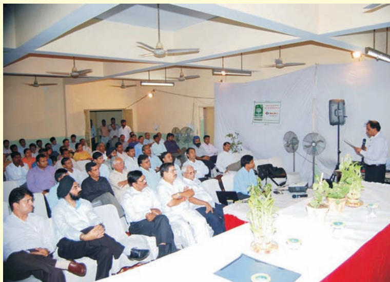
Founder's Day celebration by Delhi & Noida Parivar. दिल्ली और नोएडा परिवार ने स्थापना दिवस मनाया.

Competitions were also organized by Ranjangaon Unit (Essay, Speech, Drawing, Colour-filling at Shirur based Vidya dham Prashala ), Bhubaneswar (Debate by Engineering & Management students on 'Suggested measures for Energy Conservation'), Raipur (Speech competition on 'Role of Energy Conservation in Saving Environment' by MRS Senior Secondary Girls' School ).