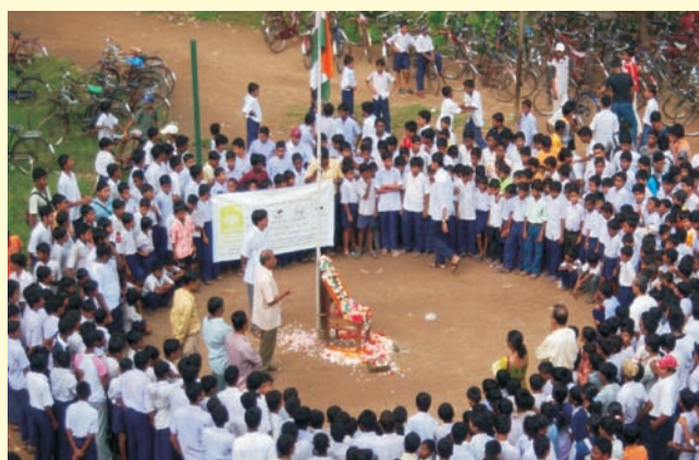
Tree plantation followed the flag hoisting in Janai Training High School, Hooghly District on 15th August 2008

१५ अगस्त २००८ को भुवनेश्वर के भारतीय विद्यालय में वृक्षारोपण.