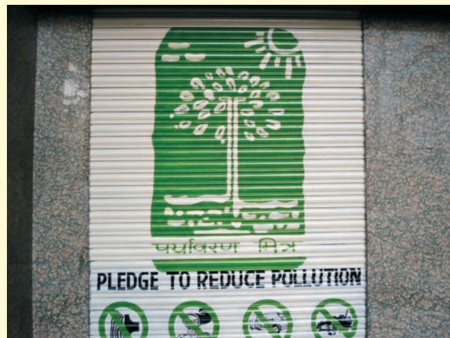
Bangalore PM Parivar painted PM Message on the shutters. बंगलौर पीएम परिवार ने शटरों पर पीएम का संदेश पेंट करवाया.