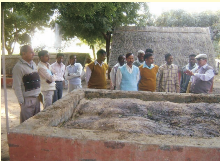
Shikohabad: The participants at the site of organic manure pit.

Around 20 farmers were registered in the camp. They were awarded certificates. Shashikant Pandey conducted the programme.