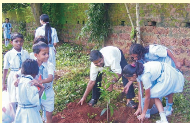
Bhubaneswar : Tree plantation in in Bhartiya Vidyalaya on 15th August 2008.

हैदराबाद में चिल्ड्रन एंड सोसायटी, गोलकोन्डा में वृक्षारोपण किया गया.