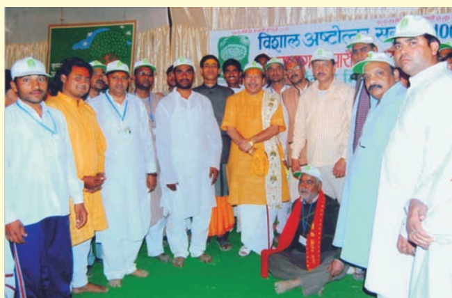
Shri Thakurji with PM enthusiasts. श्री ठाकुरजी पीएम प्रेमियों के साथ

बाद में, ११ मई २००८ को चंडीगढ़ के पीएम परिवार ने पर्यावरण के बारे में जागरूकता फैलाने के लिए ठाकुरजी की कथा में भाग लिया. प्रवेश द्वार पर पीएम बैनर लगाए गए. चंडीगढ़ पीएम परिवार के सदस्यों ने दो स्टॉल भी लगाए.