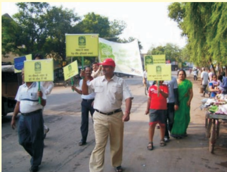
Rally in Raipur

In order to spread knowledge about various dimensions of environment protection, Awareness Camps and Campaigns were organized by PM Parivars of Chennai, Hyderabad, Noida and Nagpur (in association with the Forest Department & Citizen Forum for Equality; Hon. Satish Chaturvedi, Guardian Minister of Maharashtra also participated).