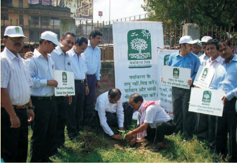
Tree plantation in Guwahati on Founder's Day.