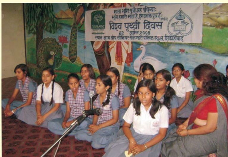
Shikohabad: Gyandeep School girls rendering a song on "World Earth Day" शिकोहाबाद : "विश्व पृथ्वी दिवस" पर गायन प्रस्तुत करती ज्ञानदीप स्कूल की छात्राएं.