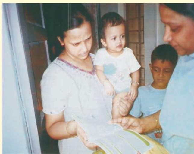
PM Coordinator explaining PM initiatives to a resident in a door-to-door campaign.